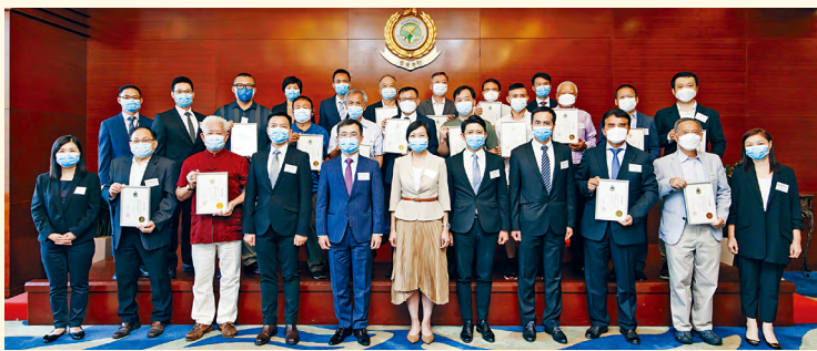
■三個物流運輸業聯絡小組成員委任典禮分別於二〇二二年九月舉行。

二〇二二至二四年度的「跨境運輸業顧客聯絡小組」、「道路貨物資料系統用戶聯絡小組」和「便利轉運貨物清關業界諮詢小組」成員委任典禮及小組會議於二〇二二年九月舉行，各聯絡小組成員獲頒發委任證書。三個小組自成立以來，一直為跨境物流運輸業提供有效平台與香港海關和其他政府部門交流，部門會繼續以小組作橋樑，加強與業界聯繫。