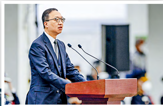
■律政司司長林定國資深大律師致辭。

為加強青少年對《憲法》的認識，同場設立憲法教育區，並舉辦「我眼中的國家憲法日」攝影比賽，讓青少年發揮無限創意，利用鏡頭及網上平台表達他們在「國家憲法日」的所見所感，以提升其國民意識及對國家的認同。