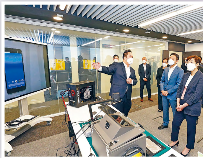
■關長與管理層聽取電腦法證專家介紹各種法證工具。

為應對各種新型的科技罪行、網絡罪行及應付不斷上升的工作量，海關持續增撥資源於電腦法證工作上，包括增加人手與器材，以及擴建電腦法證所。擴建後的辦公室大力提升部門處理電腦法證的能力，優化了同事的工作環境，並新增設多用途室可安排不同形式的會議及訓練。電腦法證所會繼續為部門於打擊科技罪行方面作出更多貢獻，提供更先進的法證支援。