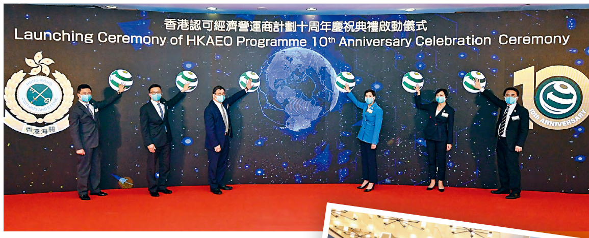
■商務及經濟發展局局長丘應樺（左三）擔任主禮嘉賓，與海關關長何珮珊（右三）和部門首長級官員一同主持慶祝儀式。