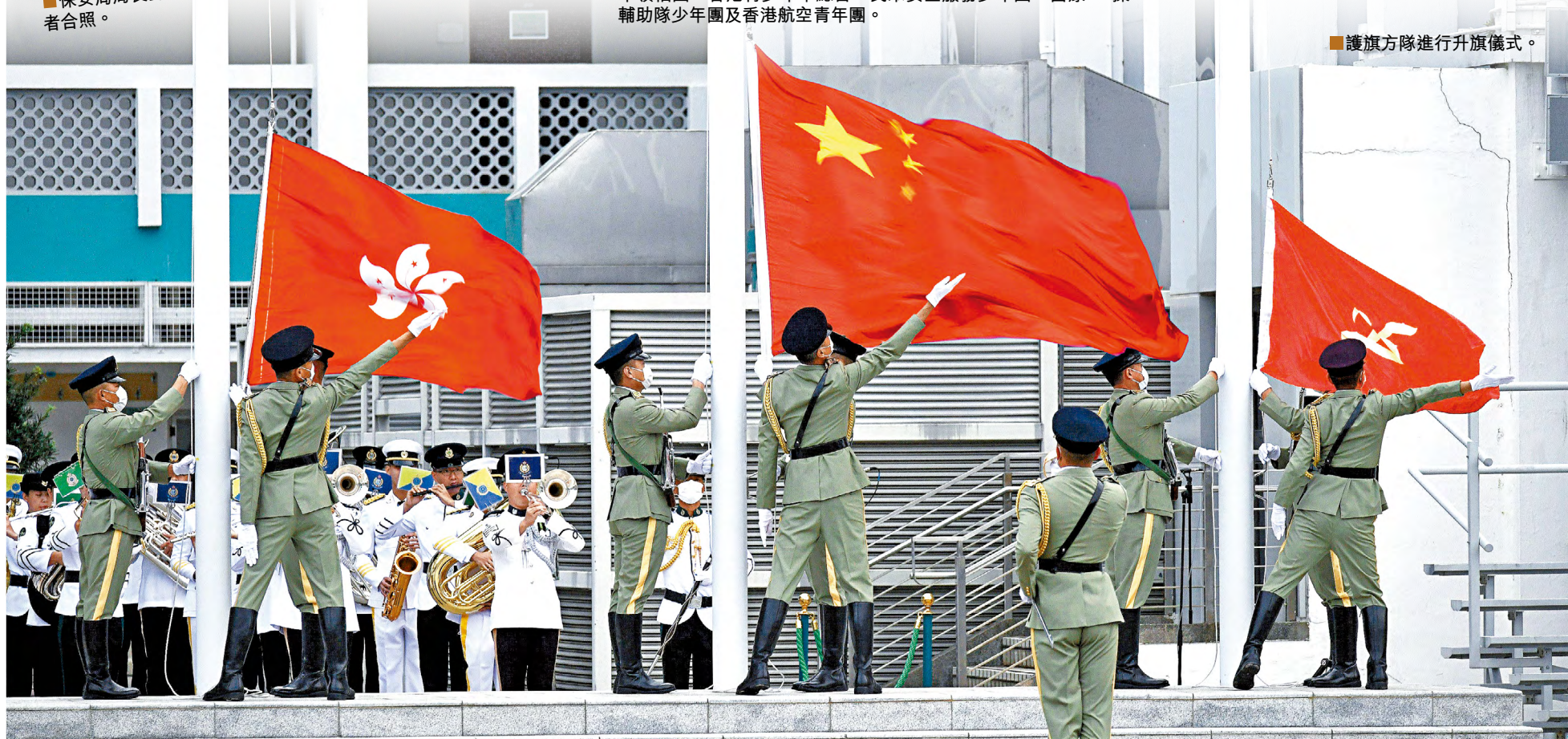
■護旗方隊進行升旗儀式。