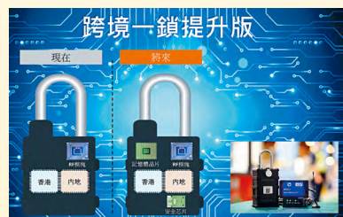
■新的電子鎖將符合國家安全標準制式，有助兩地海關深化及推進相關清關便利的合作。

海關早前獲創新及科技局撥款進行研究如何加強系統的保安，以及將電子鎖提升至完全符合國家安全標準制式。整個研究於二〇二一年十二月完成，新系統及設備將於香港各陸路邊境管制站和清關點安裝。