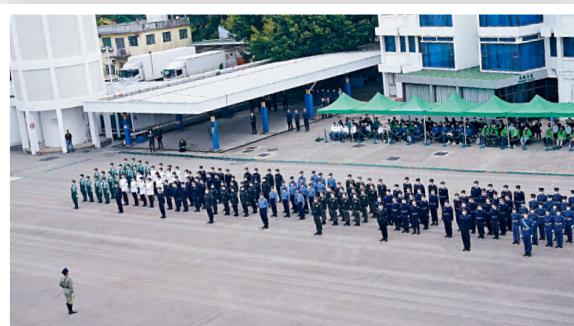
■參與步操的九個青年團體，包括少年警訊、更生先鋒領袖、消防及救護青年團、海關青年領袖團、入境事務處青少年領袖團、香港青少年軍總會、民眾安全服務少年團、醫療輔助隊少年團及香港航空青年團。