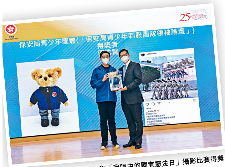
■保安局局長鄧炳強（右）與「我眼中的國家憲法日」攝影比賽得獎者合照。