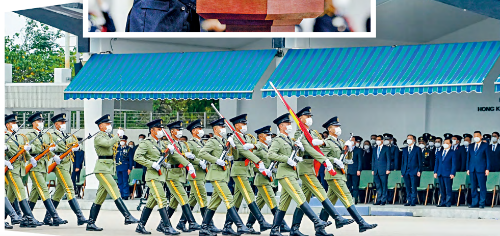
■護旗方隊以中式步操進場。