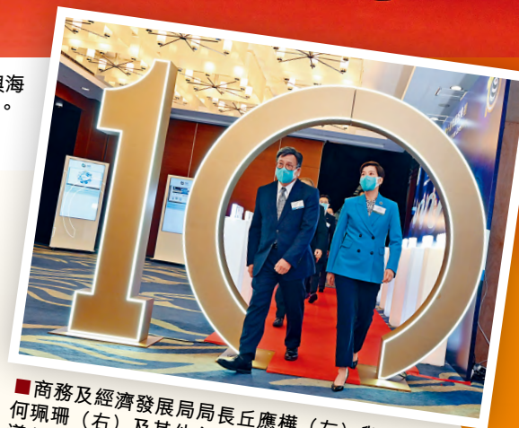
■商務及經濟發展局局長丘應樺（左）與海關關長何珮珊（右）及其他主要嘉賓經過「十周年時光隧道」進場。