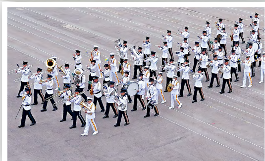
■升旗儀式首先由紀律部隊聯合樂隊（包括香港警務處、香港海關、入境事務處及香港懲教署）進行軍樂操。