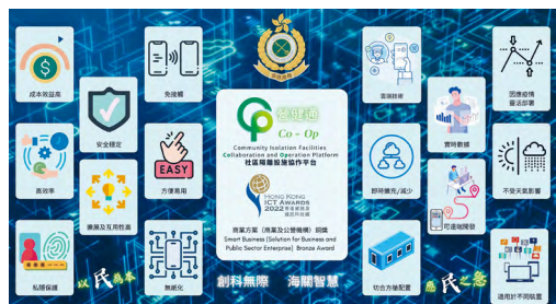
■圖示「營健通」各種功能和特色。

「營健通」在2022香港資訊及通訊科技獎中榮獲商業方案（商業及公營機構）銅獎，評審委員會讚賞海關僅以七天時間便開發「營健通」，在政府項目中，從未見過如此敏捷的開發項目。