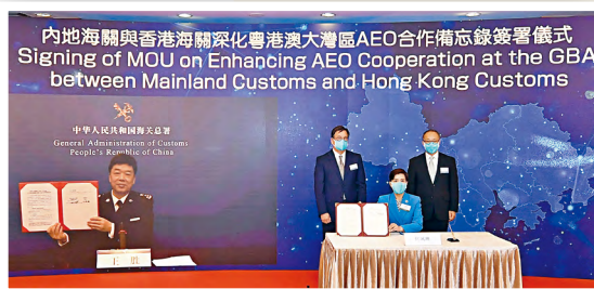
■海關關長何珮珊（前排）與國家海關總署企業管理和稽查司司長王勝（螢幕上）簽署內地海關與香港海關於深化粵港澳大灣區「認可經濟營運商計劃」合作備忘錄。簽署儀式在商務及經濟發展局局長丘應樺（後排左）和中聯辦經濟部副部長兼貿易處負責人劉亞軍（後排右）的見證下以視像形式舉行。