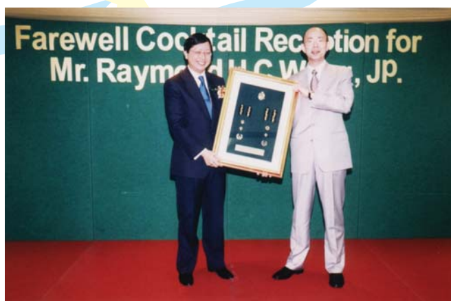
署理關長黃秀培在歡送酒會上頒贈紀念品予前關長黃鴻超。

他讚揚海關同事在各方面，包括提升清關效率、打擊走私、盜版及冒牌、私煙、非法燃油、毒品、非法轉運紡織品活動、監管戰略物品進出口、及保障消費者權益等，均取得卓越的成績。