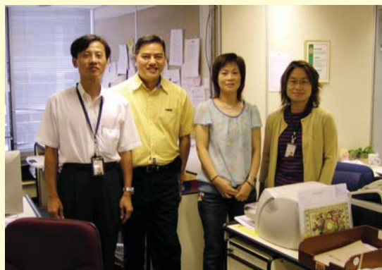
紡織品情報小組成員。