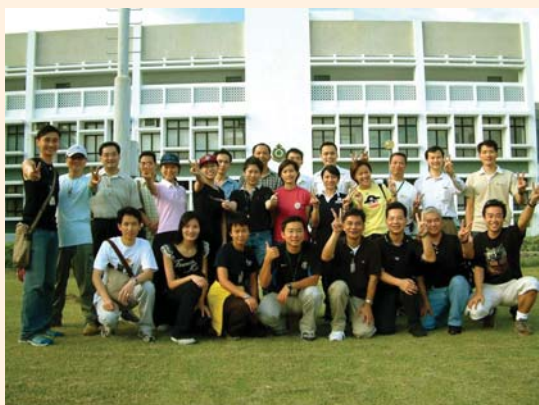
學員於工作坊完結時在海關訓練學校合照。

機場科聯同公務員培訓處於二〇〇三年六月至十一月期間，為科內所有中層管理人員舉辦十堂中層管理溝通工作坊。每個工作坊為期兩天，包括一天的課堂理論及一天的戶外練習。