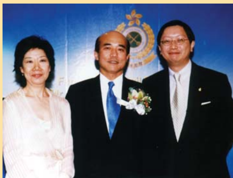
海關高級官員會所

高級官員會所於二〇〇三年七月二十一日為副關長李偉民舉行榮休歡送酒會。當日出席的嘉賓冠蓋雲集，更承蒙保安局局長葉劉淑儀、財經事務及庫務局局長馬時亨、多個政府部門首長、外國駐港使節、社會賢達及外國海關駐港代表的蒞臨，令酒會生色不少。酒會在李Sir一番感人的告別演說後完滿結束。