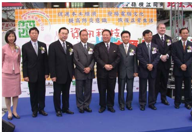
民政事務局局長何志平（左五）、助理關長周藹桐（左二）及一眾嘉賓為香港電腦節2003揭開序幕。

大匯展會場內設有八十多個國際電腦科技產品的展銷攤位，貨品種類繁多。深水埗區以銷售高科技電腦及軟件聞名，海關參與是次活動相信有助加強市民購買正版電腦軟件的意識。