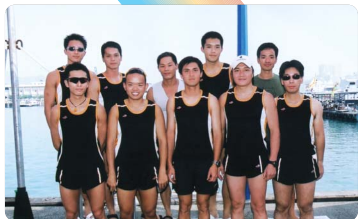
彩艇隊各隊員精神抖擻合照。

為了方便大家多作運動，以保持身心健康，職員關係課已將林士街部隊健身室的更衣室設施加以改善。除更換了男更衣室的沖身設施外，更在男、女更衣室內添置了風筒和直身鏡，方便大家在運動之後梳洗整妝。此外，本課亦已因應同事的要求將更衣室內沖身格的浴簾改為掩門，以增加安全感。如大家對部隊健身室有任何意見，歡迎致電2852 1416與本課職員聯絡。