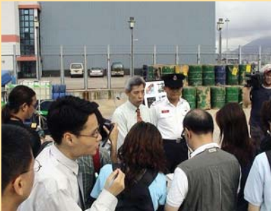
海關及消防處向記者簡報打擊非法燃油活動的聯合行動。

柴 油管制組的同事一向積極地制定執法策略，打擊非法燃油活動。去年十月至本年五月的一連串執法行動中，該組人員成功截獲大量從內地走私到港的非法燃油。