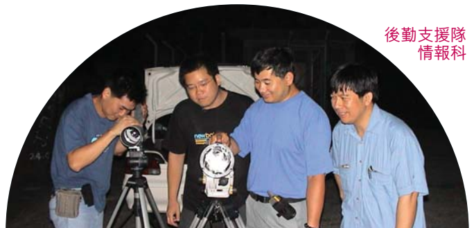
後勤支援隊 情報科

總括來說，我們希望從與前線人員的溝通中了解他們的工作和技術需要，從而引進更多新的器材以配合行動需要，令部門調查人員能有效地發揮打擊海關罪行的職能。