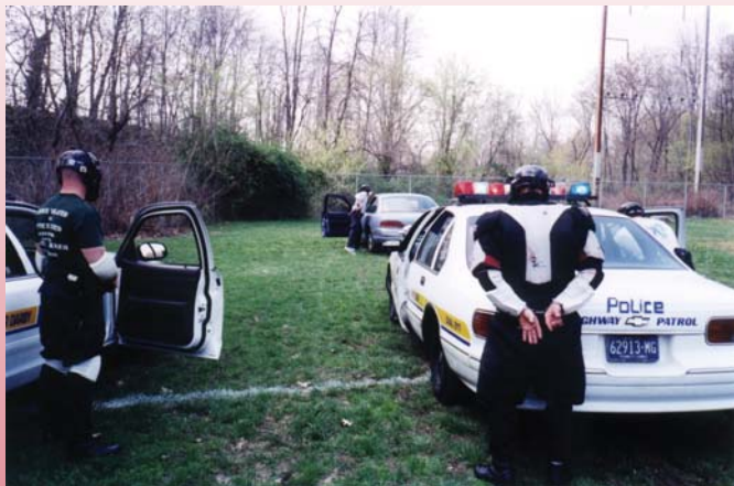
主辦單位以真的警車作模擬練習。