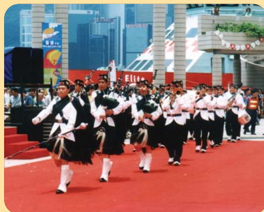
海關樂隊進行表演。