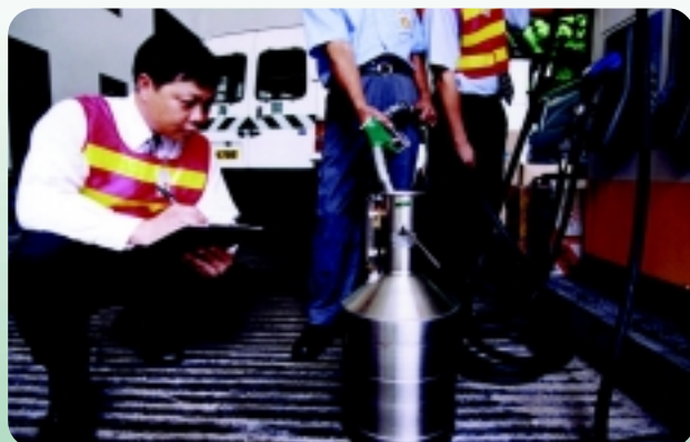
▷ 消費者保障課人員在油站測試油標。