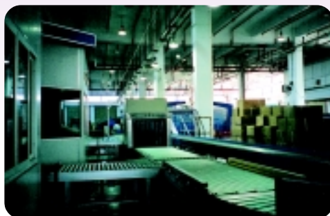
◀ 設於上海海關國際快件監管中心內的海關監控區。