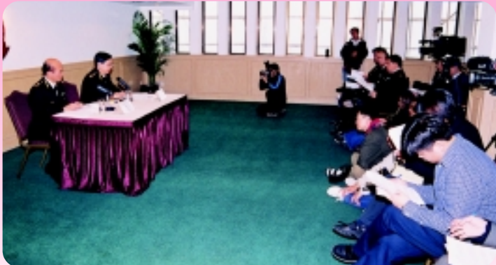
△ 關長黃鴻超向傳媒代表簡介部門過去一年的工作成果。