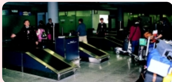
◀ 機場海關人員為航空旅客提供優質清關服務。