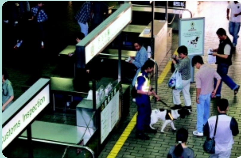
△ 機靈犬「啫哩」於羅湖管制站嗅查旅客。

帶領機靈犬的工作並不簡單，工作本身既複雜且需要審慎計劃、專業知識和熟練技巧，領犬員必須找出利用犬隻的最佳方法和有利的位置進行嗅查工作，而又不