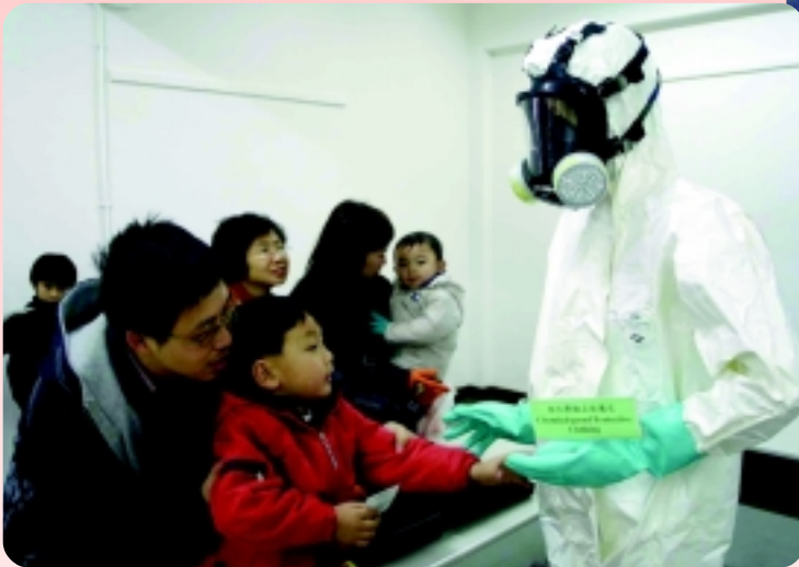
△ 市民對防化學品保護衣充滿興趣。

為支持「二〇〇二年服務市民巡禮」，海關訓練學校在一月二十六日首次開放予市民參觀。