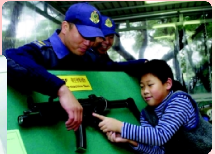
△ 一名小朋友正細心聆聽海關人員講解輕機槍的性能。