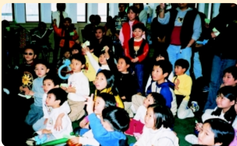
△ 聖誕老人的出現令小朋友們非常興奮。