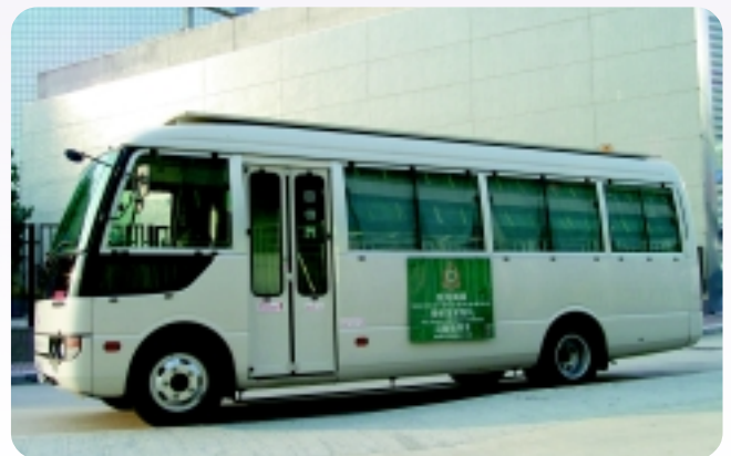
△ 搜船及貨物科的流動指揮車。