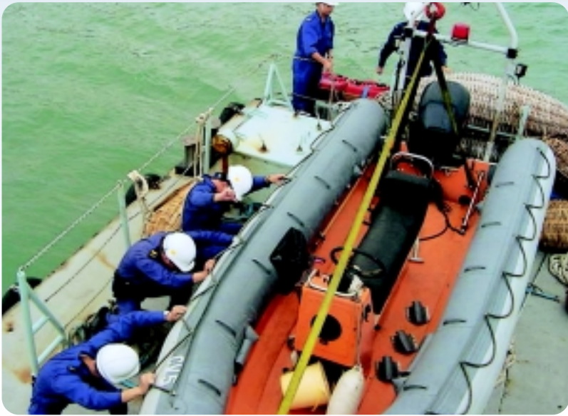
△ 學員實習從巡邏船上卸下快速橡皮艇。