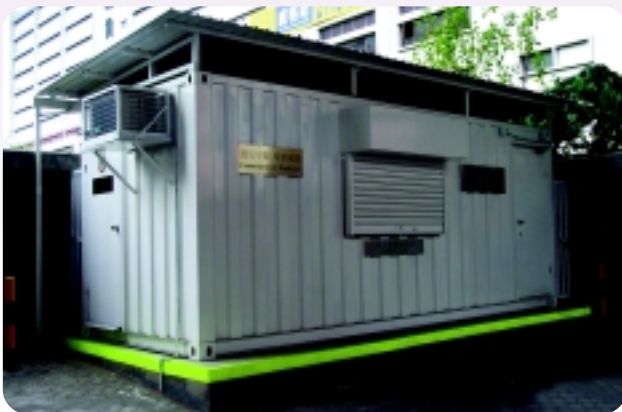
△ 搜船及貨物科在觀塘公眾貨物起卸區的「貨櫃形」辦公室。