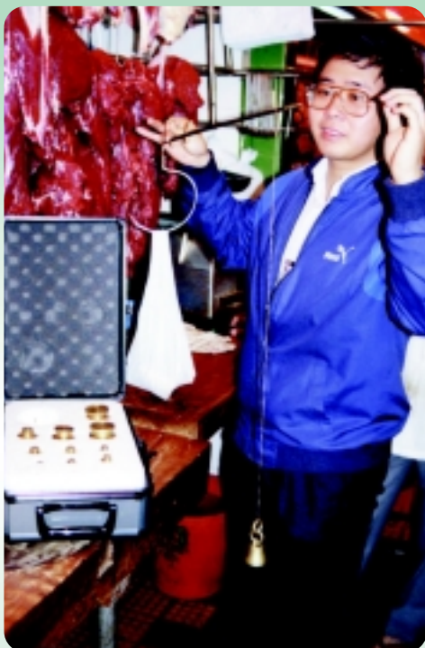
△ 消費者保障課人員在一街市鮮肉檔測試中國秤。