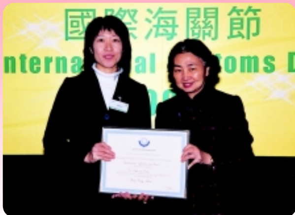
△ 律政司司長梁愛詩頒發嘉許狀予一級行政主任陳淑華。

慶祝酒會於高級官員會所舉行。主禮嘉賓為律政司司長梁愛詩。出席酒會的嘉賓超過三百名，包括立法會議員、各國駐港的使節、各政府部門首長、