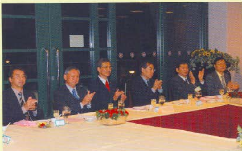
(左起) 澳門海關關長徐禮恒、保安局局長李少光、海關關長湯顯明、海關總署副署長兼廣東分署主任劉文杰與一眾嘉賓出席酒會後所舉行的香港海關聯絡晚宴。