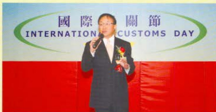
香港演藝人協會名譽會長許冠文表演「棟篤笑」，稱讚海關緝毒犬的執法能力，笑言若正版光碟帶士多啤梨味，便可讓海關緝毒犬在各口岸協助嗅查盜版光碟。

魔高應信道更高，似明鏡的心永不染塵。 真假黑與白要分，眼內透激光，照穿黑暗。 極密仍突破，發揮本能，實現把關決心。 不依規則的不許發生，誠信是我應有的本分， 謹記於心。 機智是我工作的積聚，分秒必爭。 踏刀山火海英勇果敢，像抽絲剝繭仔細尋。 前行遇到風益緊，心愈凜！