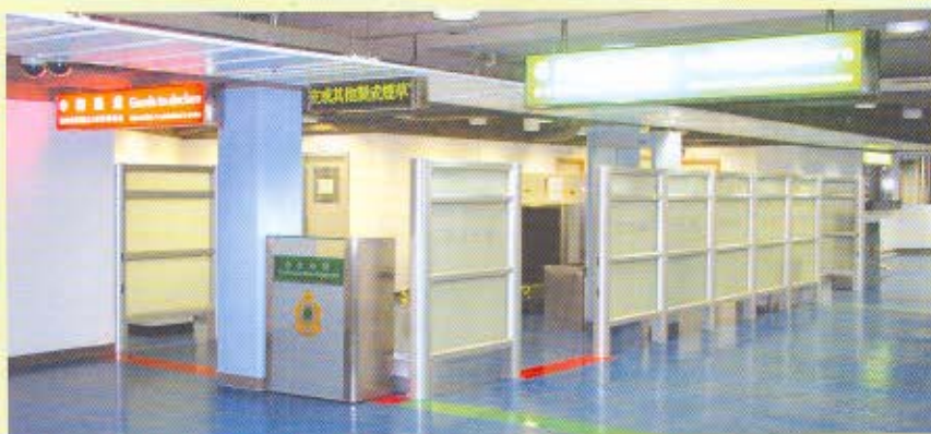
海關在屯門客運碼頭管制站入境和離境大堂設有清關室，配備X光行李檢查機和金屬探測器等設備。

另外，沙頭角管制站的擴建工程於2006年6月完成，海關佔用的面積增加三倍至七百多平方米，提供額外的工作空間及清關設施。