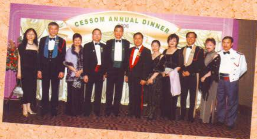
懲教署署長郭亮明(左二)、入境事務處處長黎棟國(左四)、海關關長湯顯明(左五)、消防處處長郭品強(左六)、警務處副處長(管理) 馮兆元(右三) 和政府飛行服務隊行政總監畢耀明(右一) 在晚宴上合照。