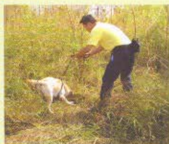
領犬員和海關緝毒犬在案發現場的草叢中搜尋毒品。

三頭海關緝毒犬「威格」、「奧尼」和「波里」在2006年11月13日一項瑞麗市公安局的緝毒行動中，成功檢獲700克海洛英。當時，牠們仍在海關總署緝私局雲南瑞麗緝毒犬基地接受訓練。