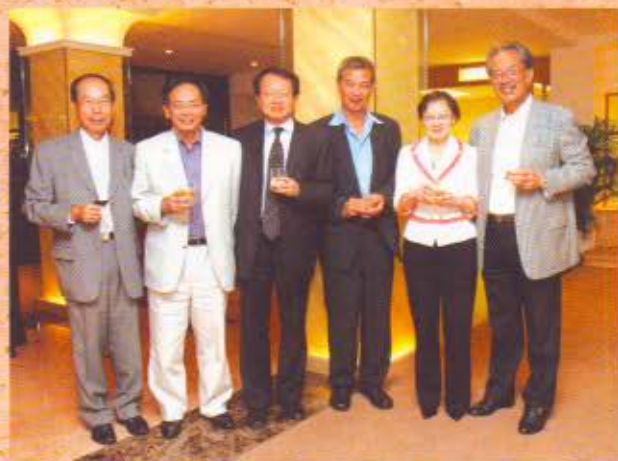
(左起) 全國政協委員廖正亮、民主建港協進聯盟副主席葉國謙、財經事務及庫務局常任秘書長(庫務) 黎年、海關關長湯顯明、工商及科技局常任秘書長(工商) 蔡瑩璧及立法會議員黃宜弘。