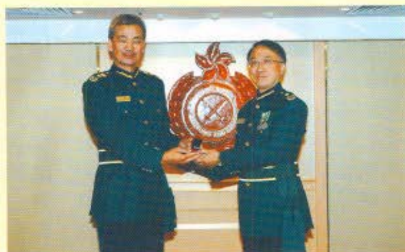
關長湯顯明頒授香港海關長期服務獎章第2加敘勳扣予助理關長梁觀華(右圖)及署理助理關長高智樂(左圖)。