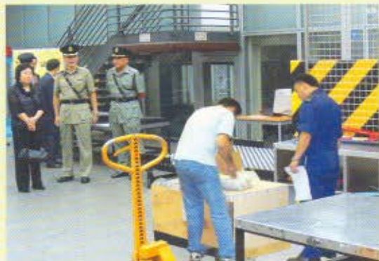
機場科總指揮官陳漢傑(左二穿制服者)向經濟發展及勞工局常任秘書長(經濟發展)鄭汝樺介紹海關對空運貨物的清關程序。

經濟發展及勞工局常任秘書長(經濟發展)鄭汝樺於2006年8月31日參觀機場科空運貨物課，以了解前線海關人員在空運貨物清關工作。