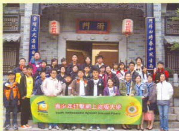
青網大使、導師和海關版權及商標調查科人員攝於電視城古裝街。