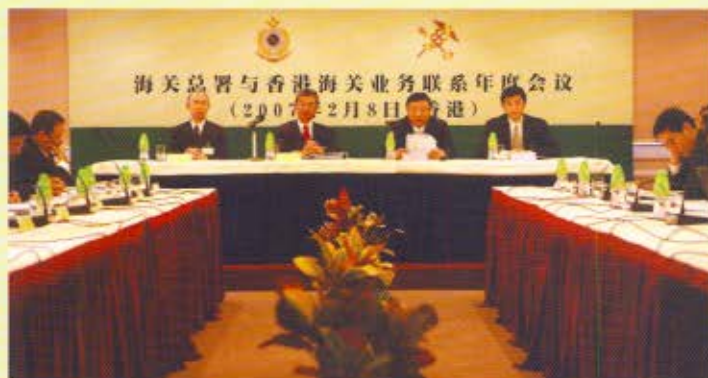
在業務聯繫年會上，海關總署與香港海關討論加強合作事宜。