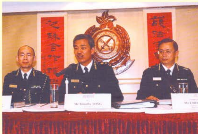
海關關長湯顯明(中)表示，透過海關強力執法，不同範疇的非法活動黑點數目不斷下降。旁為副關長黃秀培(左)和助理關長(邊境及港口)周廣(右)。

2007年是「海關年」，香港海關會繼續堅守「護法守關、專業承擔」的使命，為市民提供優質