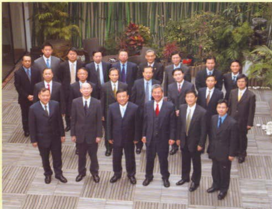
海關總署副署長孫松璞(前排左三)和香港海關關長湯顯明(前排右三)與兩地代表團合照。