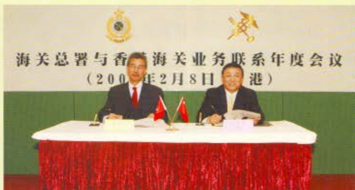
會後，香港海關關長湯顯明(左)和海關總署副署長孫松璞簽訂會議紀要。合作範疇包括通關、緝私和培訓。

中 華人民共和國海關總署副署長孫松璞率領七人代表團於2007年2月8日與香港海關進行「業務聯繫年度會議」。