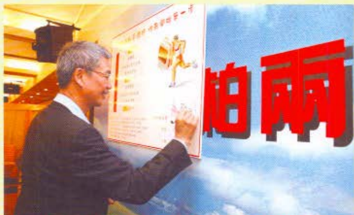
海關關長湯顯明率領員工簽署健康約章，齊齊參與部門健康活動。

部 門刊物《海柏》創刊兩周年，海關於2006年10月27日舉行慶祝活動，由海關關長湯顯明率領員工簽署健康約章，齊齊參與部門健康活動。參與健康約章的員工均獲頒計步器。