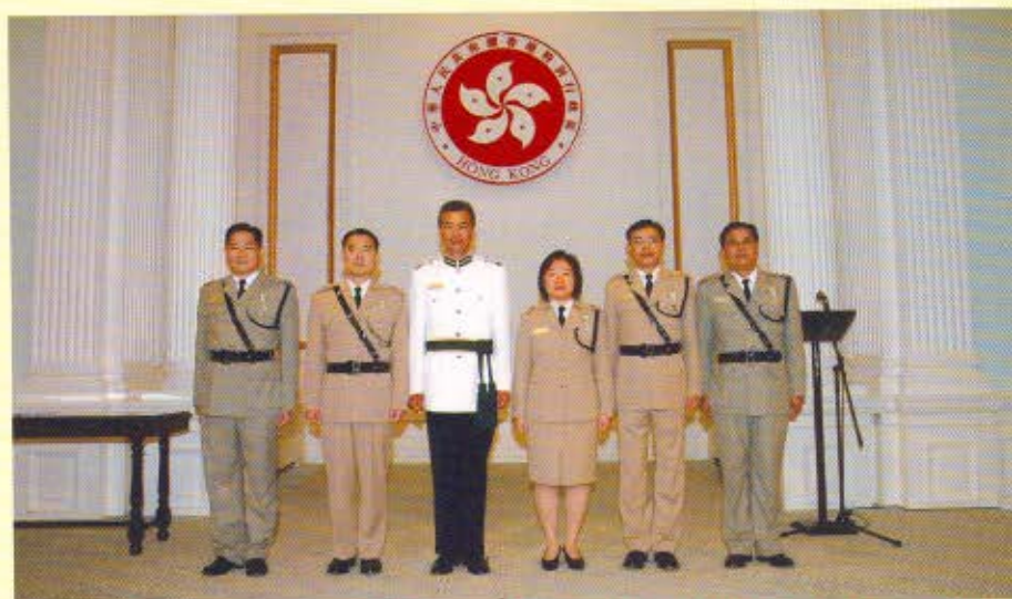
五名海關人員獲特區政府頒發「香港海關榮譽獎章」。 (左起) 總關員凌達宗、高級監督梁麟祥、海關關長湯顯明、高級監督黃慧安、高級監督俞官興和總關員劉志強。