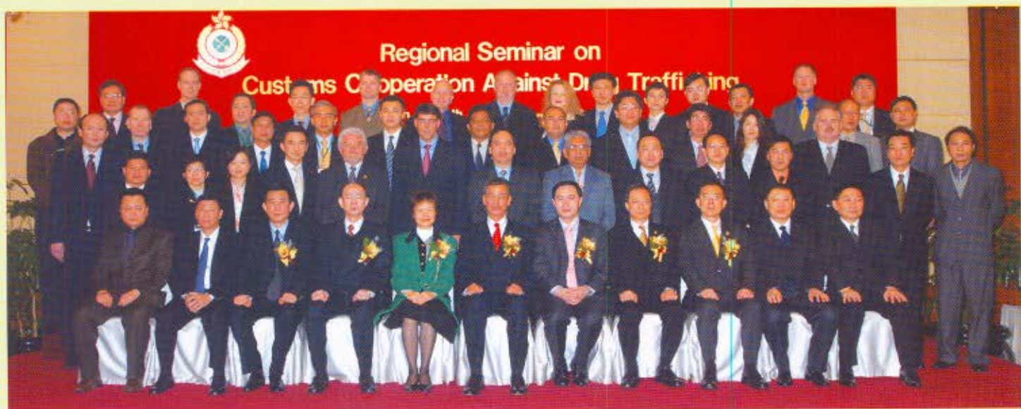
海關關長湯顯明(前排中)、禁毒專員黃碧兒(前排左五)、海關副關長黃秀培(前排左四)、海關助理關長(情報及調查)譚耀強(前排右四)、海關毒品調查科高級監督梁麟祥(前排右三)、海關總署緝私局副局長劉曉輝(前排右五)、海關總署廣東分署副主任兼緝私局局長李耀南(前排左三)主持開幕典禮，並與出席交流會的內地和海外海關以及緝毒機構代表合照。