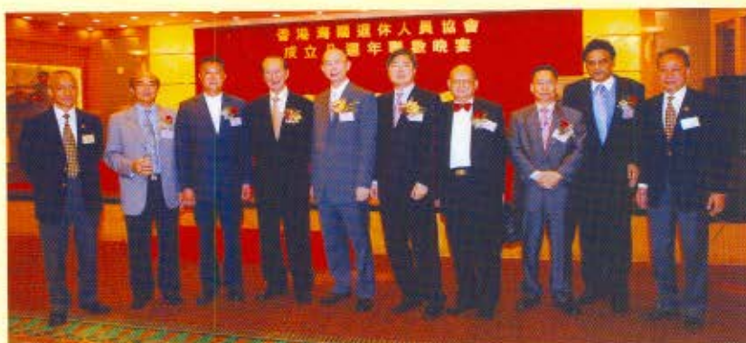
海關副關長黃秀培(左五)與部分香港海關退休人員協會會長合照。