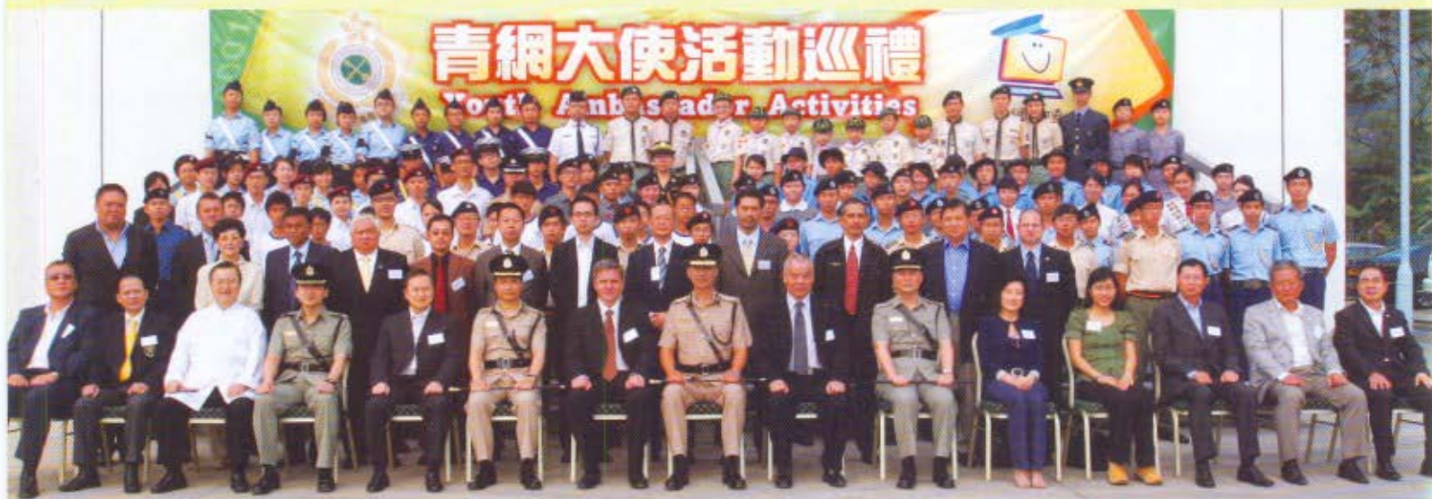
海關關長湯顯明(前排中)與「青網大使」、版權業界和海外海關代表合照。