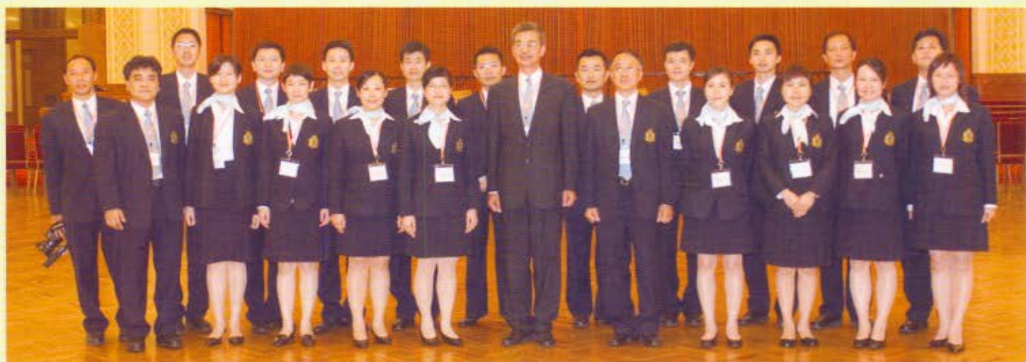
海關關長湯顯明(前排右六)率領海關代表團會見國務委員兼公安部部長周永康後，在人民大會堂與代表團合照。

海 關關長湯顯明與海關助理關長(行政及發展)梁觀華率領21位海關人員於2006年9月21日至27日到北京和雲南考察。