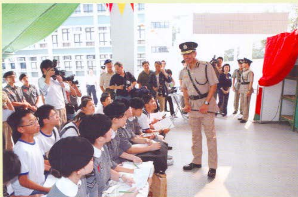
海關關長湯顯明與青網大使進行互動遊戲。

香港海關關長湯顯明2006年10月14日主持「青網大使」計劃的首項教育活動，勉勵出席的青少年：「『青網大使』肩負重任，除了監察和通報網上侵權活動外，還需發揮一個良好市民的責任，合力推廣保護知識產權的意識。」