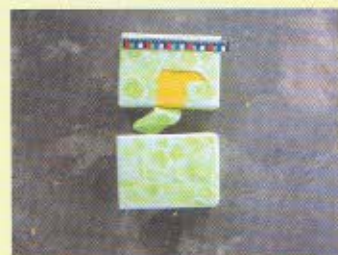
行動中，海關緝毒犬檢獲海洛英。