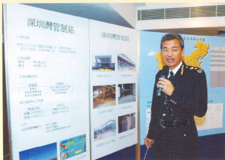
在回顧海關二〇〇六年工作的記者會上，海關關長湯顯明簡介深圳灣管制站海關設施。

的科系，包括策劃及發展科、訓練及發展科、資訊科技科、部隊行政科和財務管理科等，現正努力不懈地工作，做好各方面的安排。