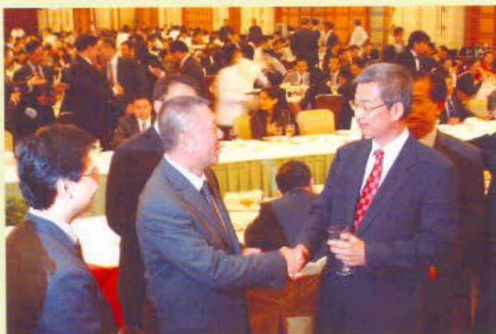
香港海關關長湯顯明出席澳門海關成立五周年慶祝晚宴，並與澳門特區行政長官何厚鏞交談。左一為香港海關助理關長(稅務及行動支援)歐陽可樂，而右一為香港海關貿易管制處處長張細思。

海 關關長湯顯明率領代表團於2006年11月6日前往澳門考察「珠澳邊境工業園區」(珠澳園區)，並出席澳門海關成立五周年慶祝晚宴。