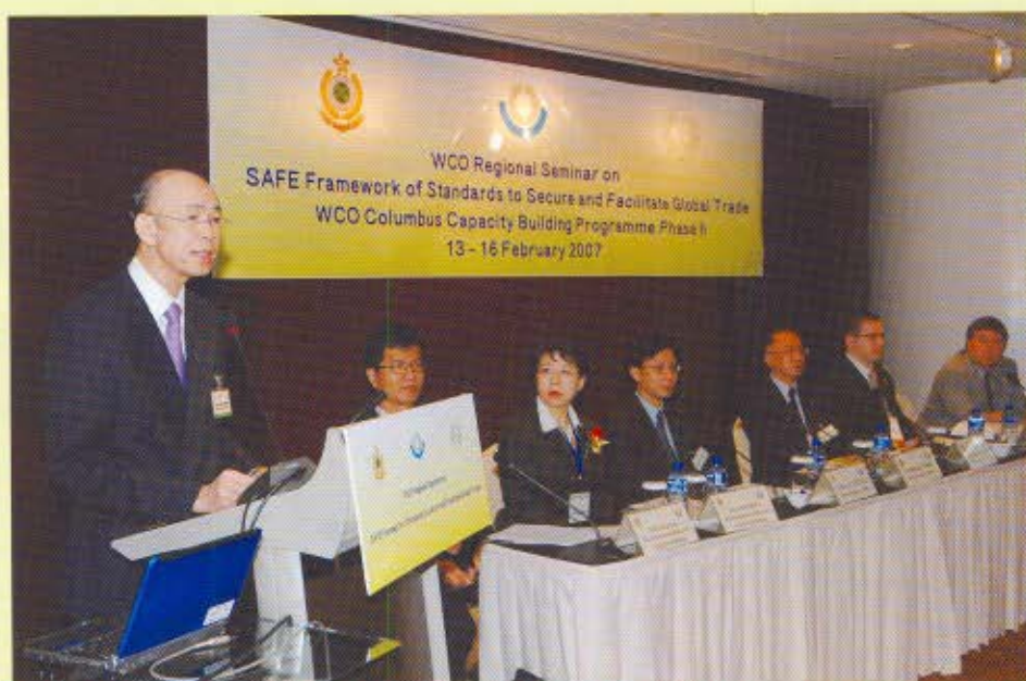
海關副關長黃秀培在會議上致辭。他表示，只有各方齊心協力才能成功推行框架，鼓勵物流業界積極參與。

世界海關組織於2005年6月在理事會全體會議上採納框架。至今，144個世界海關組織成員已申明同意推行框架，其中25名成員來自亞太區。