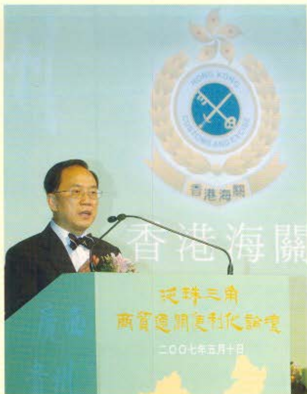
行政長官曾蔭權在論壇開幕儀式上致辭。