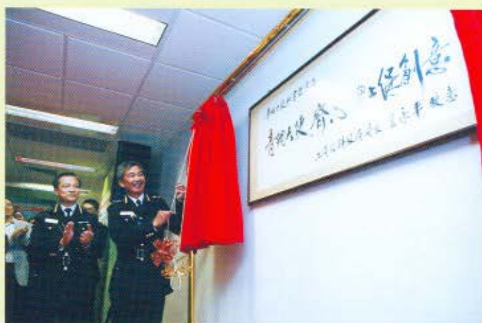
工商及科技局局長王永平特別為「青網大使」秘書處啟用題字。 海關關長湯顯明在啟用儀式上為銘牌揭幕。

他說：「海關一方面嚴厲執法、與業界緊密合作，另一方面積極推廣保護知識產權教育活動。只要各方聯手，定能徹底打擊全港的盜版活動。」