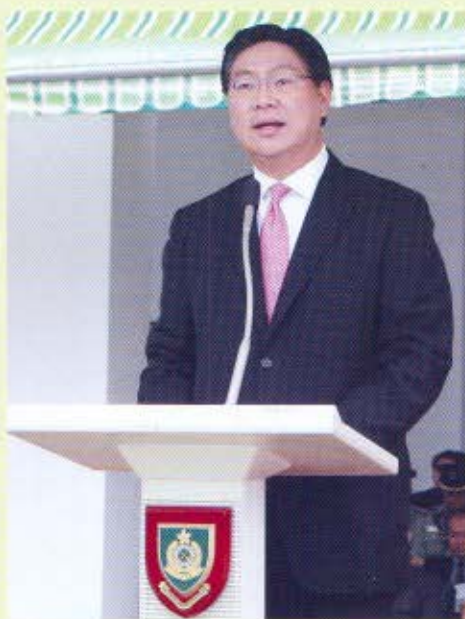
財經事務及庫務局局長馬時亨檢閱會操後，與海關督察分享他對海關的感受。

馬時亨局長於5月22日出席67名海關督察的結業儀式，對海關打擊私煙和私油的工作，致力保障庫房稅收的決心和成績，表示稱許。