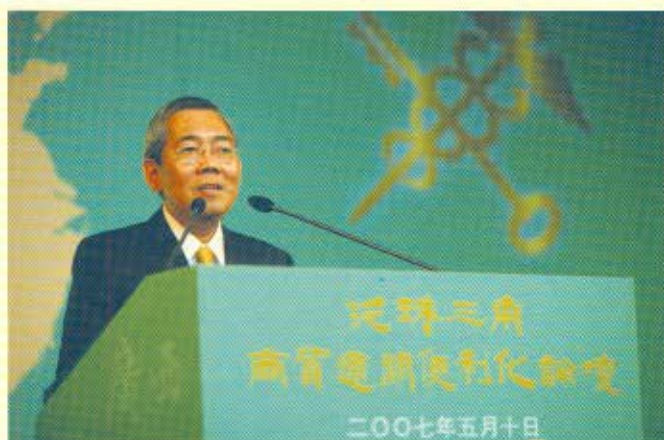
工商及科技局局長王永平宴請出席商貿通關便利化論壇的嘉賓，在晚宴上致歡迎辭。