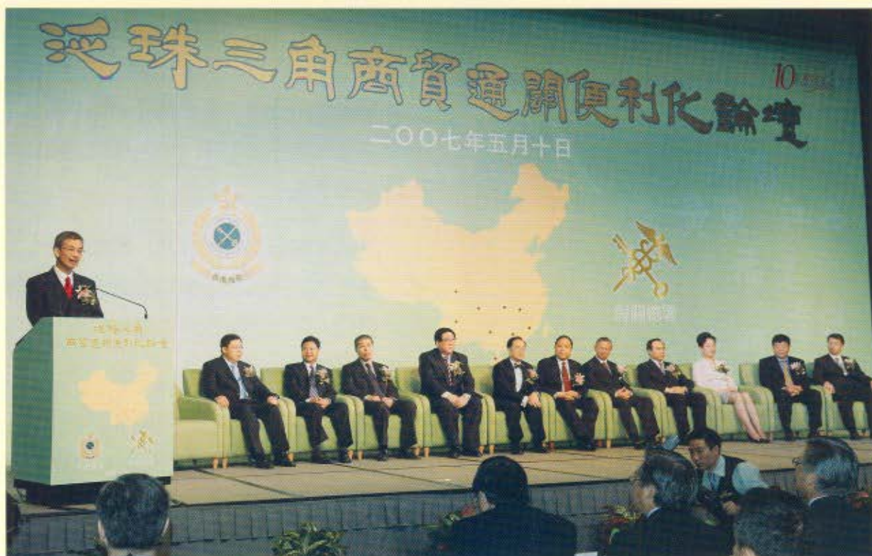
香港海關關長湯顯明在開幕上介紹各主禮嘉賓。