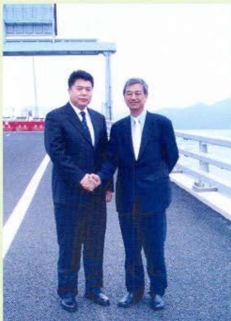
香港海關關長湯顯明（右）與深圳海關關長鄧志武會晤後合照。

會上，雙方探討藉着深圳灣口岸的開通，發展更深層次的「一地兩檢」合作模式。為加強兩地清關協調工作和有效打擊跨境走私活動，雙方將會制定「通關管理協作備忘錄」，在深圳灣口岸成立一個聯合辦