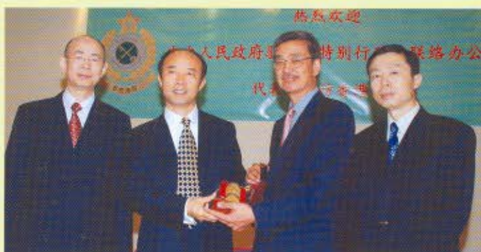
香港海關關長湯顯明（右二）與中聯辦副主任郝耀偉（左二）交換紀念品。