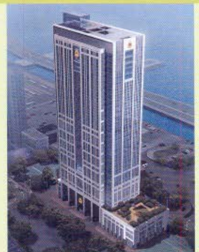
海關總部大樓鳥瞰圖。

為使部門人員了解將興建的總部大樓設施，部門從建築署取得大樓模型，暫存放於高級官員會所供各同事參觀。