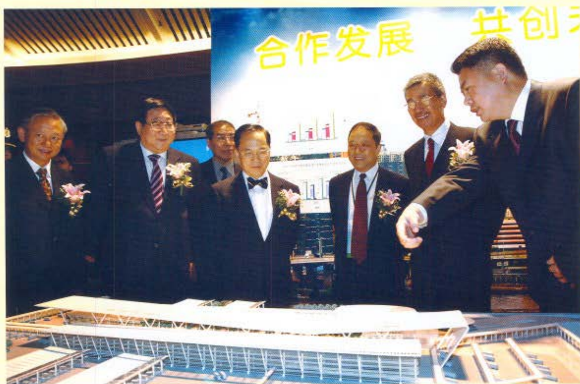
主禮嘉賓在開幕儀式前，參觀深圳灣口岸旅檢大樓模型。（左起）保安局局長李少光、中央人民政府駐香港特別行政區聯絡辦公室主任高祀仁、海關總署副署長兼廣東分署主任劉文杰、行政長官曾蔭權、海關總署署長牟新生、香港海關關長湯顯明。深圳海關關長鄧志武（右一）在旁講解。

論壇得到國家海關總署牟新生署長的鼎力支持、總署和廣東分署各領導以及泛珠各海關的全力配合，得以順利舉行。牟署長親自率領海關總署和廣東分署20多位司局級領導及30多位處級幹部、泛珠九省區16位直屬海關關長，以及國務院港澳辦及商務部的官員來港出席了大會和關長聯席例會，共同探討泛珠三角區域海關合作和加強執法的措施。