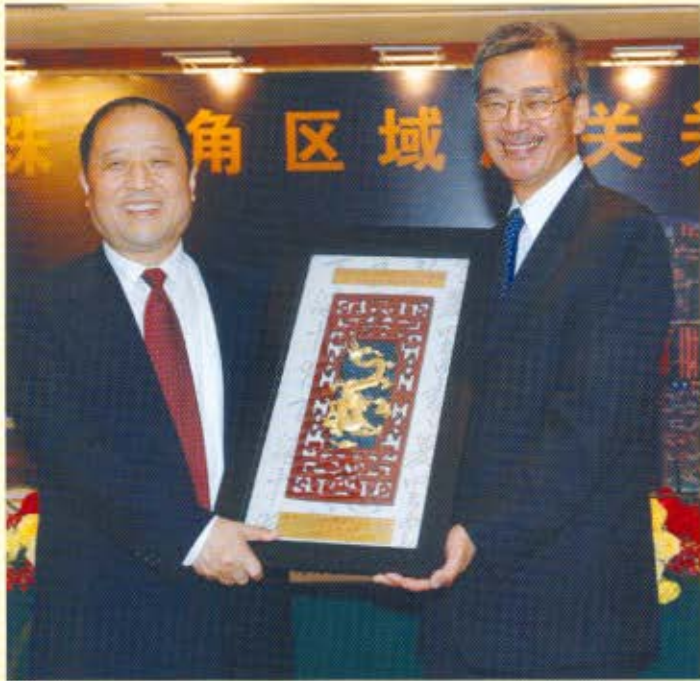
香港海關關長湯顯明（右）於區域海關關長聯席例會上致送紀念品予海關總署署長牟新生。