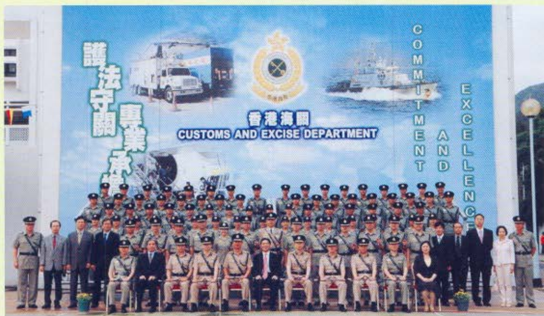
財經事務及庫務局局長馬時亨（前排中）、海關關長湯顯明（前排左五）、海關管理層和各部門主管與結業的海關督察合照。

香港海關體育及康樂會名譽會長兼香港海關人員子女教育信託基金委員會委員蔡志明博士於4月27日出席104名海關關員的結業儀式致辭時，讚揚海關在疏導物流及配合國際供應網絡運作方面的工作，積極協助業界減低營運成本，鞏固香港作為國際商貿及物流中心的地位。