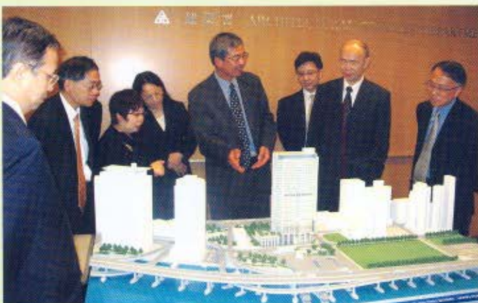
海關關長湯顯明（左五）與海關首長級人員在建築署副署長劉穎筱（左四）陪同下參觀海關總部大樓模型。

海關總部大樓的興建計劃已進入了新里程，建築署於3月29日將標書批予成功投得工程合約的承建商瑞安建築有限公司。