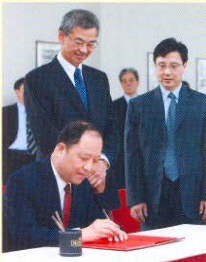
牟新生參觀香港海關訓練學校，並題字作留念。