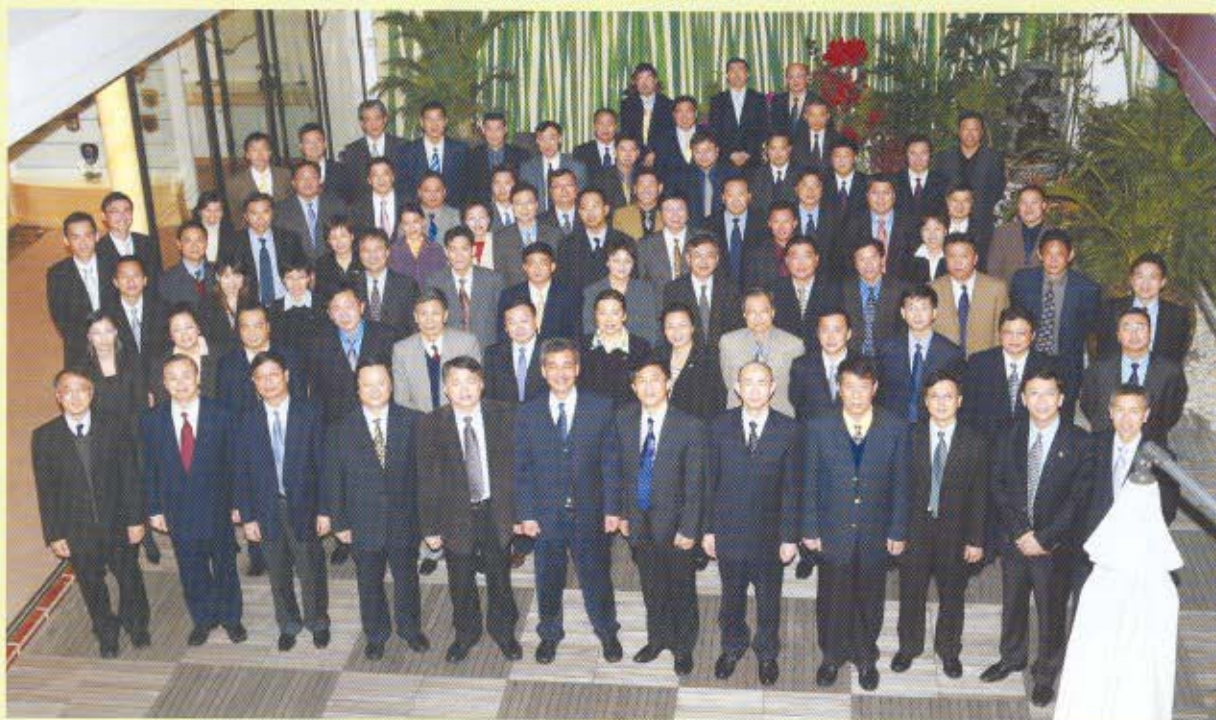
香港海關關長湯顯明宴請邊境海關關長代表團，期望內港海關繼續保持更緊密合作。晚宴前，湯關長（前排左六）率領香港海關管理層和各部門主管，與海關總署國際司司長朱高章（右六）和邊境海關關長代表團成員會面。

為加深了解香港海關工作，中央人民政府駐香港特別行政區聯絡辦公室（中聯辦）和海關總署代表團分別於3月訪問香港海關。