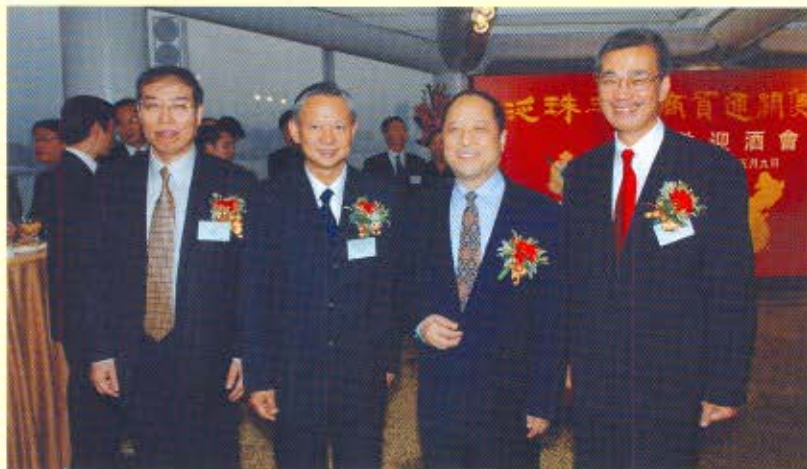
保安局局長李少光（左二）與海關總署署長牟新生（右二）、副署長兼廣東分署主任劉文杰（左一）和香港海關關長湯顯明（右一）在泛珠三角商貿通關便利化論壇歡迎酒會上合照。