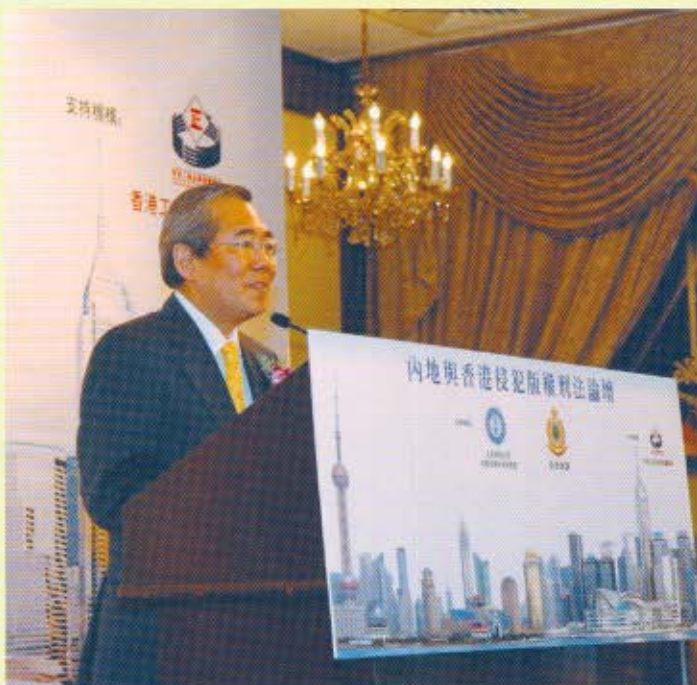
工商及科技局局長王永平於開幕儀式致辭。

香 港海關與北京師範大學刑事法律科學研究院於3月30日在香港合辦「內地與香港侵犯版權刑法論壇」，讓百多位來自兩地執法機關、學術界、司法界和知識產權業界代表，探討內地和香港知識產權刑法，以助日後制訂更適切的執法策略。