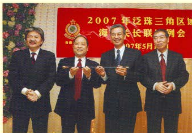
香港海關關長湯顯明（右二）在海關關長聯席例會晚宴上送贈紀念品權仗予海關總署署長牟新生（左二）。左一為行政長官辦公室主任曾俊華，右一為海關總署副署長兼廣東分署主任劉文杰。