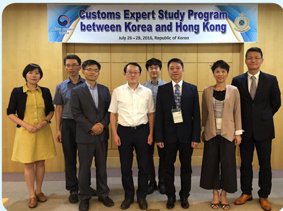
香港海關代表團與韓國海關人員於韓國海關總部合照。