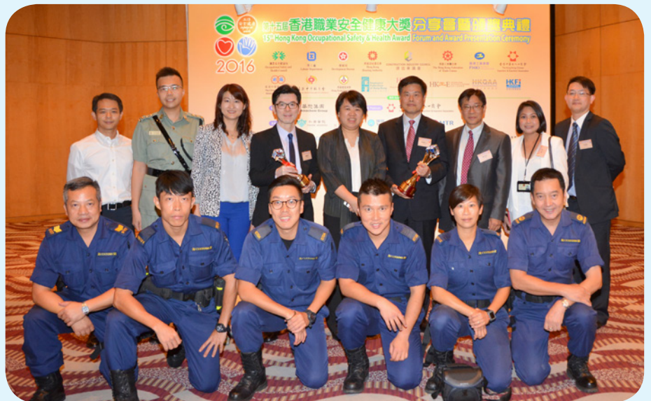
職業安全健康局總幹事游雯（後排中）及香港海關助理關長（行政及人力資源發展）連順賢（後排右四）與當日出席頒獎典禮的部門代表合照。

香港海關為表彰各同事多年來推動職業安全及健康的努力，特意參加由職業安全及健康局舉辦的第十五屆職業安全健康大獎比賽。部門首次參加是項比賽便要面對一百六十多個來自不同政府部門及私人機構的對手。憑藉部門建立的優良職安文化，部門最終於2016年9月5日的頒獎典禮中成功獲得「安全表現大獎」及「安全文化銀獎」。此外，部門透過講解及展示影片向出席者介紹部門的職安文化，並以領犬員及搜查犬的即場演出作為結尾，展現職安健於執行海關職務期間