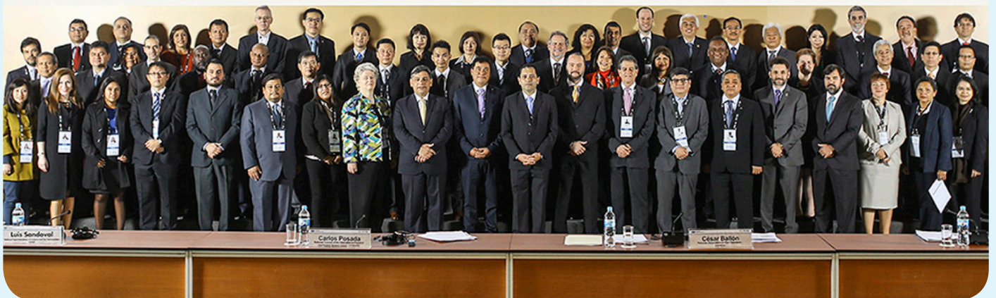
香港海關助理關長（稅務及策略支援）譚溢強率領代表團於2016年8月16日在秘魯利馬出席「亞太經濟合作組織海關與商界對話」。