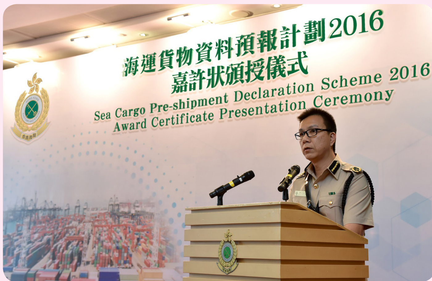
香港海關助理關長（邊境及港口）黎流栢在「海運貨物資料預報計劃2016」頒獎典禮上致辭。

香港海關於2016年8月18日在海關總部大樓舉行「海運貨物資料預報計劃2016」嘉許狀頒授儀式，表揚四十間積極參與各項預報海運貨物資料計劃，提交率達到極高或甚高水平而獲得金獎或銀獎的海運營運商。儀式由香港海關助理關長（邊境及港口）黎流栢主持。