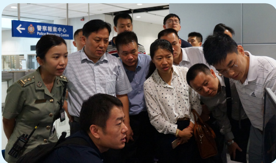
廣東海關人員參觀落馬洲支線管制站，並聽取香港海關人員講解工作流程。