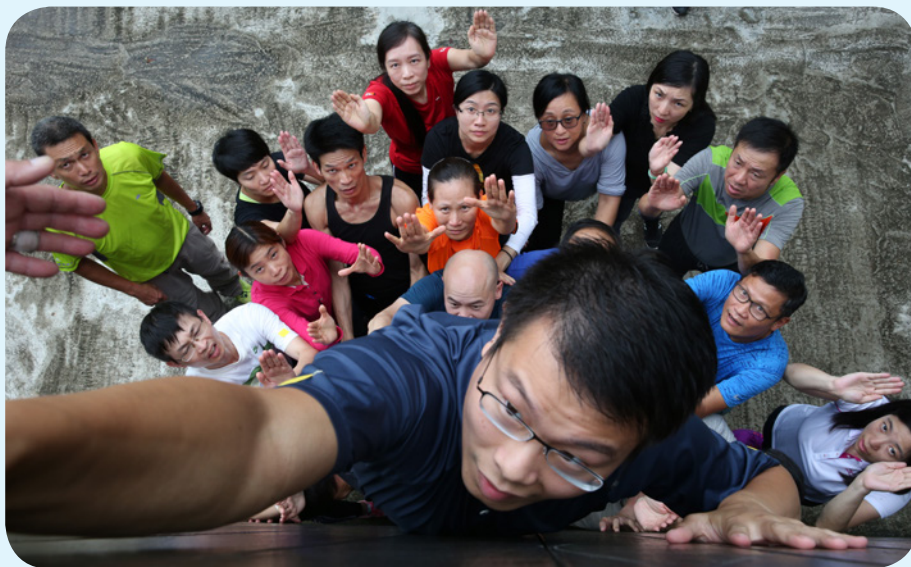
海關人員參與團隊建立及個人突破訓練。