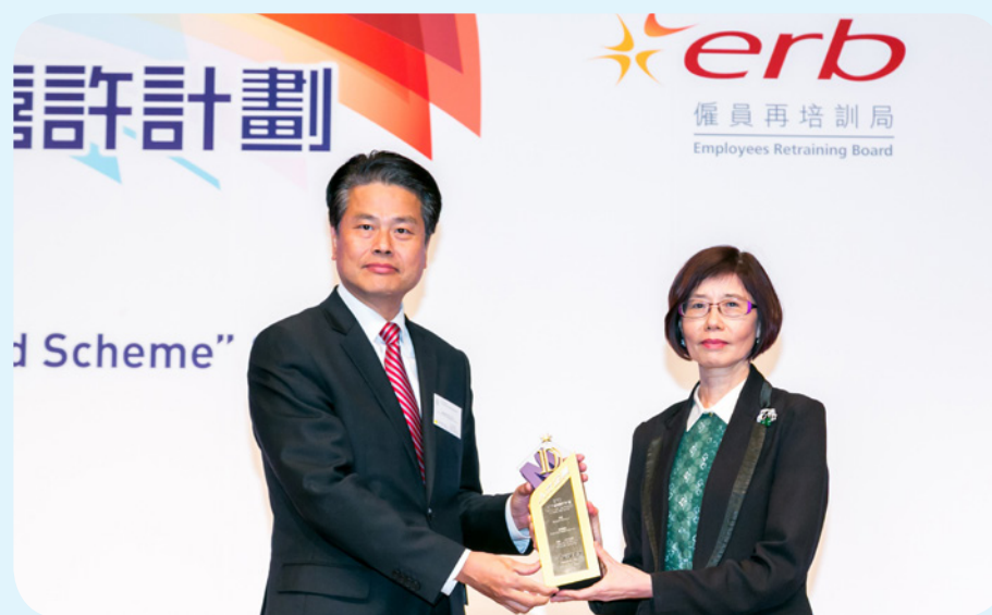
香港海關助理關長（行政及人力資源發展）連順賢（左）代表香港海關接受「人才企業」獎座。

香港海關於2015年參加了僱員再培訓局舉辦的「ERB人才企業嘉許計劃」，透過局方委任之獨立技術顧問所研發的評審範圍及評審工具，檢視及評核香港海關在「人才培訓及發展」的策劃及運作範疇之整體效率。