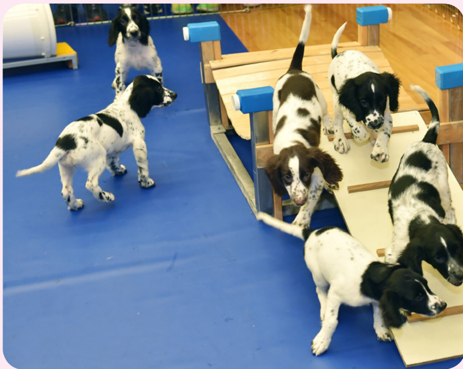
幼犬正進正平衡及四肢協調的訓練。

公布合作的成果，並吸引了二十五間傳媒機構逾五十名記者到場採訪。報刊及電子傳媒的廣泛和正面報導，大大提升了部門的專業形象。