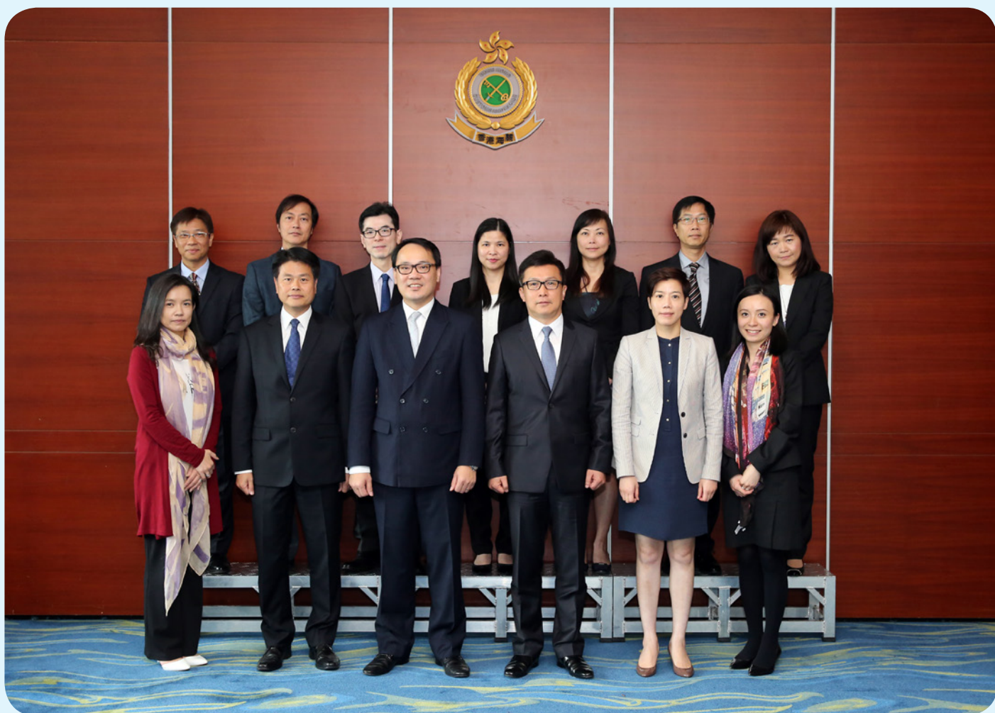
副刑事檢控專員譚耀豪資深大律師（前排左三）及政府律師與海關首長級人員合照。