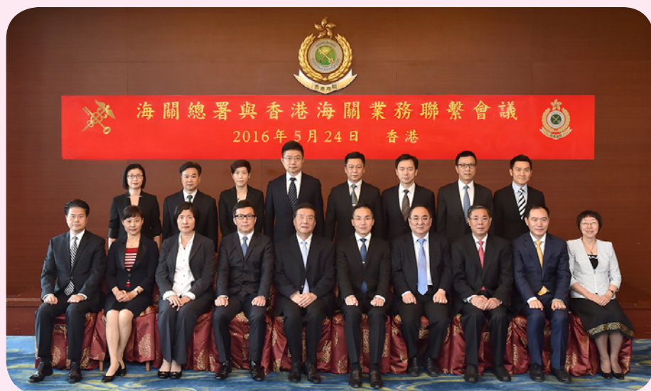
香港海關關長鄧忍光（前排右五）與海關總署署長于廣洲（前排右六）在香港出席海關總署與香港海關業務聯繫會議，並與雙方代表團合照。