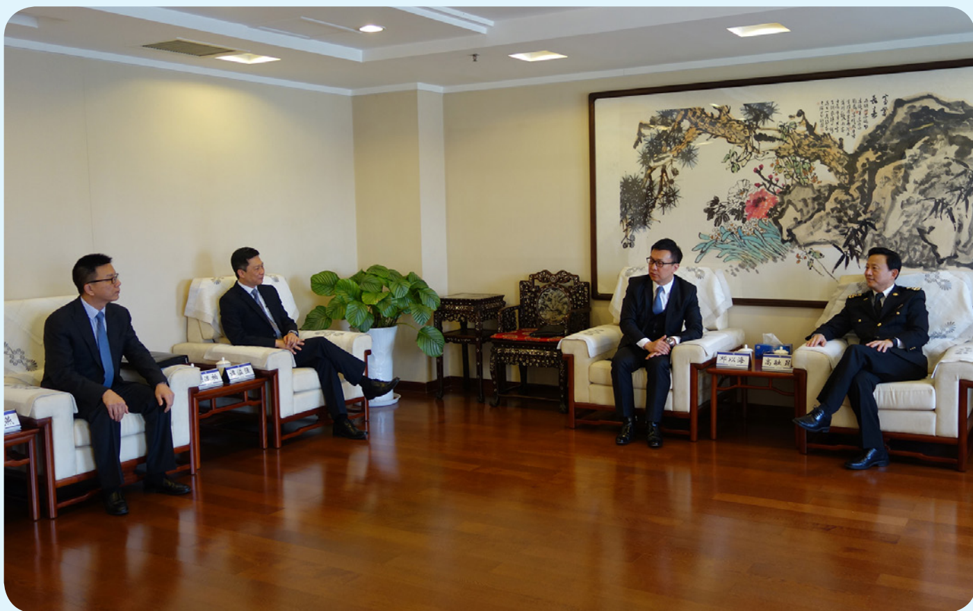
香港海關副關長鄧以海（右二）與北京海關關長高融昆（右一）會面。

香港海關副關長鄧以海上任後首次率領四人代表團於2016年4月21至22日前往北京，與中華人民共和國海關總署副署長孫毅彪、科技發展司司長陳振冲、緝私局局長劉曉輝，以及北京海關關長高融昆進行禮節性會晤。