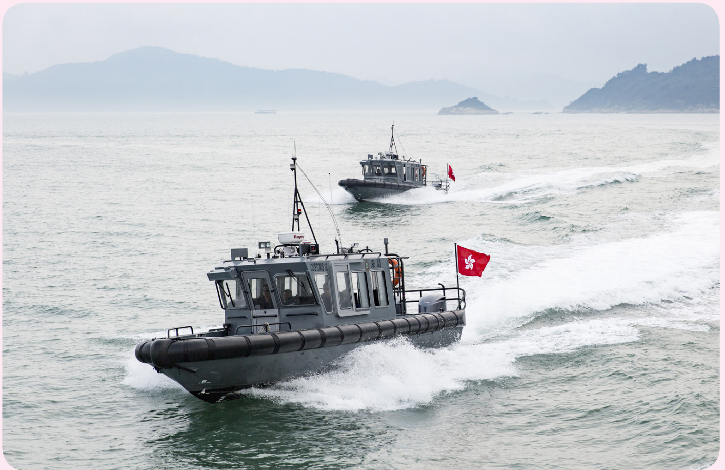
海關新淺水巡邏艇 (CE 12 & CE 13)