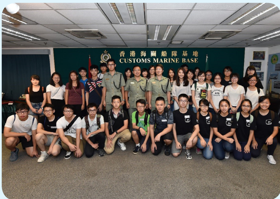
「友·導向」師友計劃參加者參觀位於昂船洲的香港海關船隊基地。