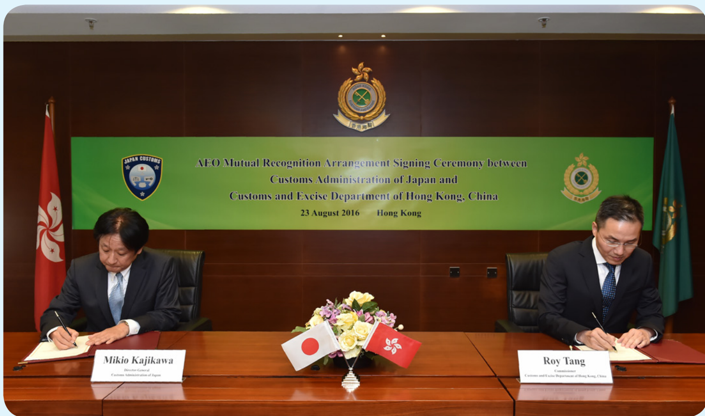
香港海關關長鄧忍光（右）與日本財務省海關及關稅局局長梶川幹夫（左）簽訂互認安排。

香港海關關長鄧忍光與日本財務省海關及關稅局局長梶川幹夫於2016年8月23日於香港簽訂互認安排，以確認彼此的「認可經濟營運商計劃」。