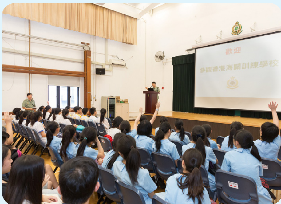
學生於職業講座上踴躍發問。