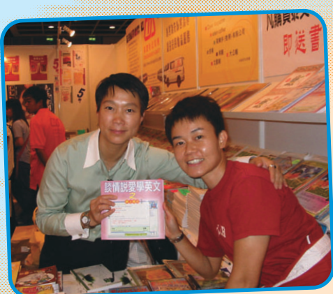
▲心血作品「出爐」，在書展中會知音，自然喜上眉梢。

三年來，我們的創作數量，已足夠編輯成書。我們決定以自資形式，找了一家出版社為我們籌辦出版事宜，經過多番努力和張羅，新書終於在二零零四年的書展中亮相，我們內心興奮之情，實在不可言喻。但最重要的，還是這本書帶給我的啟示：假如當初我畏難退縮，怕被人取笑而不踏出學習的第一步，可能到今天，還要隨身帶著部中文翻譯機，更遑論會有自己的中英文詩集了！從這個經歷我體會到，人生或多或少都會遇上困難、疑惑，只要冷靜下來，認清目標和方向，持之以恆，自強不息，面對逆境也永不放棄，最終定能跨越種種屏障而獲得成功。