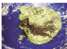
4. 加入罌粟子及黑芝麻。