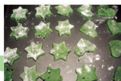
6. 把各色的曲奇放在焗盆上。

南丫島是繼大嶼山和香港島之後的第三大島嶼，面積約十四平方公里，島上居民大多住在北面地勢較平坦的榕樹灣一帶。