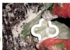
5. 麵粉壓成薄片，用曲奇餅模印出各色的圖案。