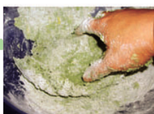
3. 加入混合好螺旋藻及麵粉搓揉。