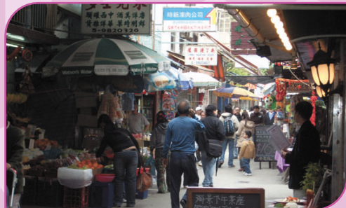
▲ 榕樹灣大街兩旁的店鋪

沿著榕樹灣碼頭向前行，踏上家樂徑，頭頂是一片碧藍的天空，無涯的海和翠綠的山坡盡收眼底，偶然會經過零星的田地，盡享大自然的氣息。沿路在向前行便是洪勝爺灣，水清沙幼，非常適合暢泳。除了享受各色美食外，遊人亦可以選擇遠足或乘單車於島上遊玩。